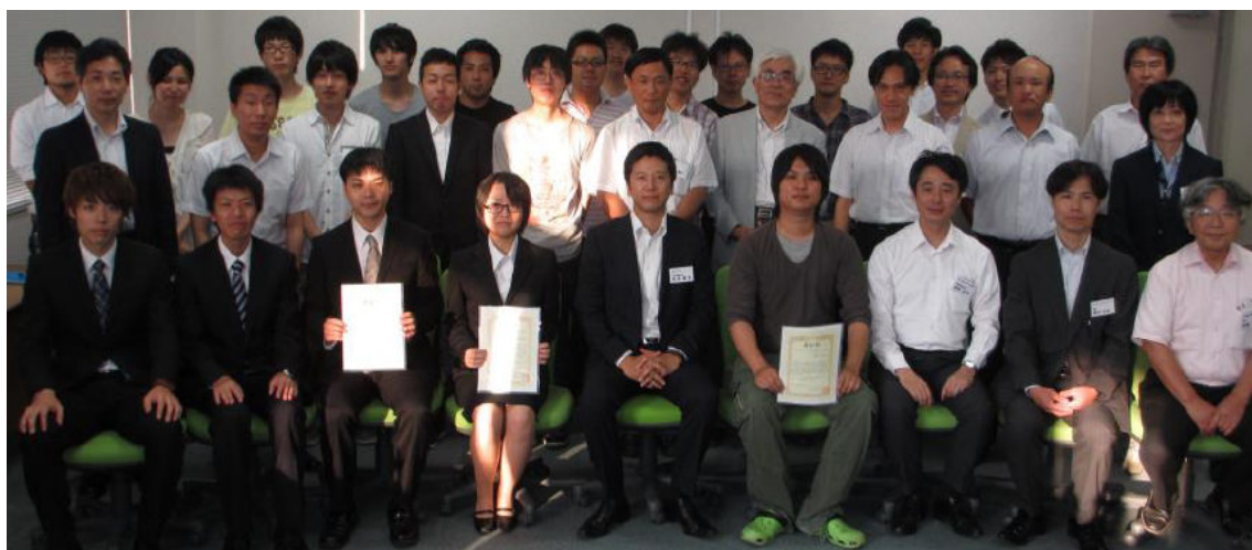
会終了後の集合写真（中央：大分産業人クラブ会長、両隣：受賞者）