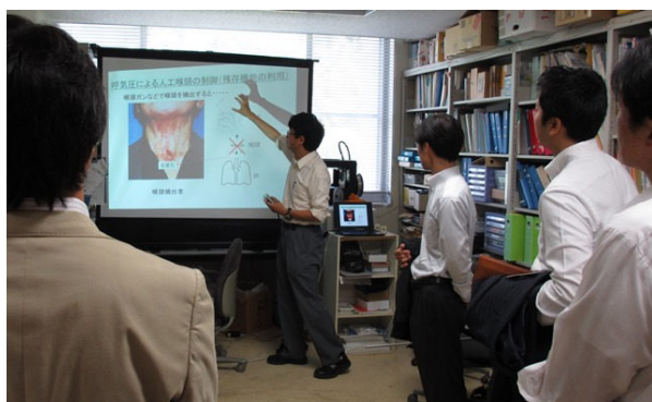
上見研究室で説明を受ける見学者