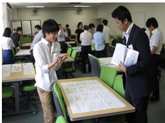
参加者に説明する学生

ポスター発表は21件(22名)が発表し、大分産業人クラブの参加者を中心に採点を行った