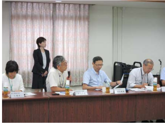
コア委員からの質疑