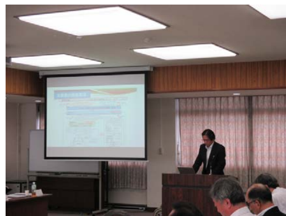
堀田学部長 今後の取組み