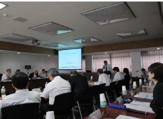
大学教員 シーズ発表