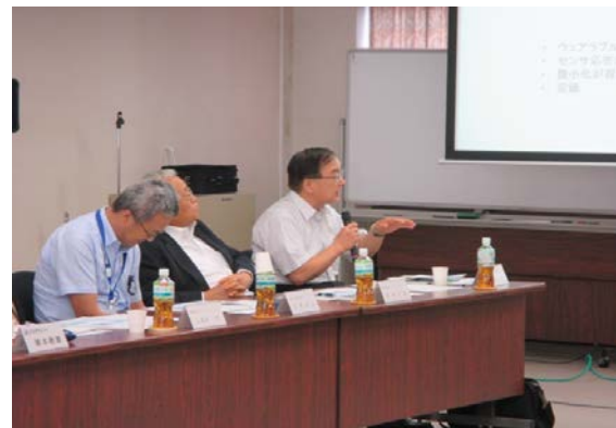
コア委員からの質疑