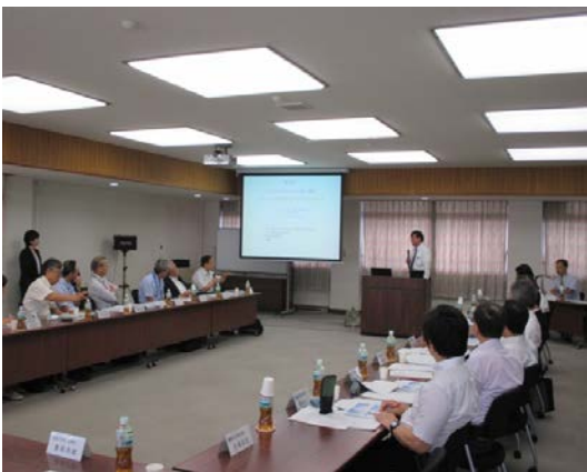
大学教員 シーズ発表